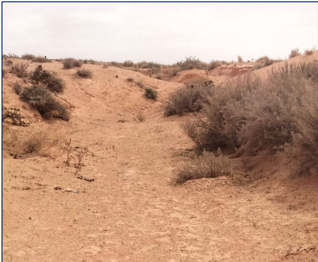
Photo. 6 : Petites collines argilo-sableuses sur les bordures de l'oued