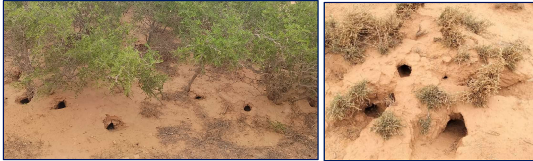
Photos 39 et 40 : Galeries et terriers du rat de sable Pasammomys obesus