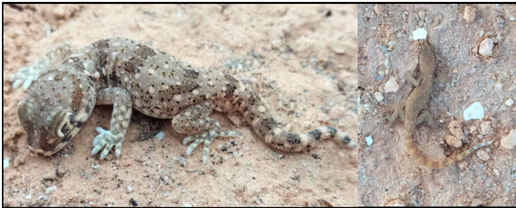
Photo. 33 : Stenodactylus mauritanicus Photo. 34 : Tropicolotes tripolitanus

Nous signalons par ailleurs, qu'un Agamidae, Trapelus mutabilis , (Photo. 35), a été capturé le 14 février 2025 sur un terrain sableux-caillouteux à la bordure de la route au niveau de l'entrée du village El Mhamla (Photo. 36).