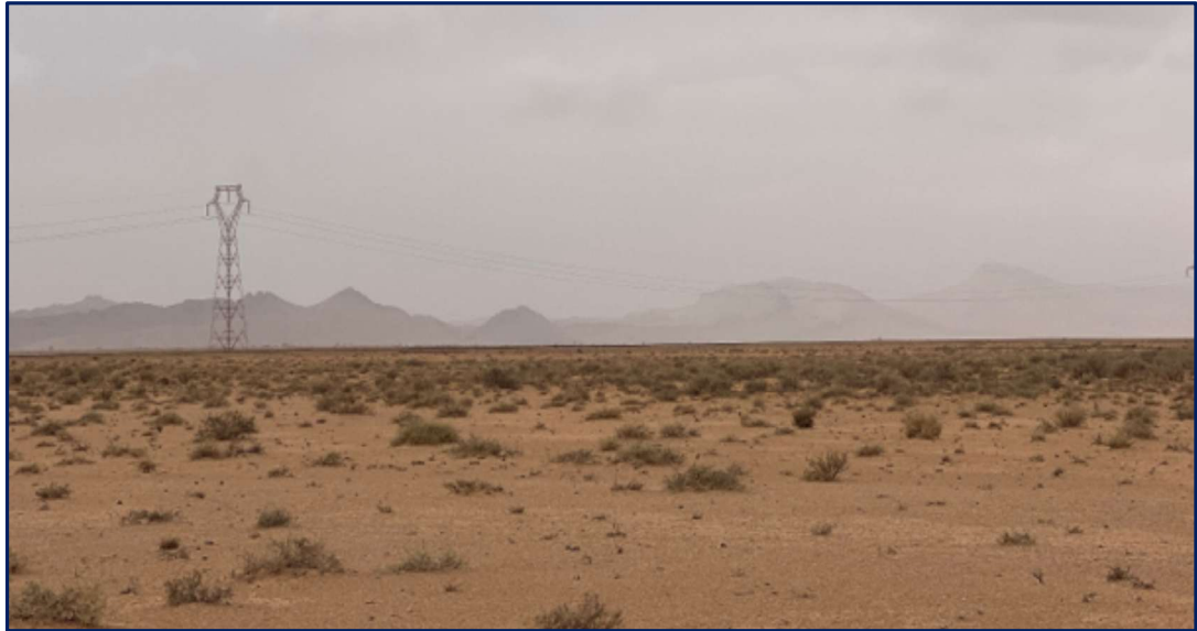
Photo. 1 : Paysage du site délimité au sud par une ligne électrique de haute tension. On aperçoit au fond de l'image la chaîne montagneuse de Dj. H'Difa.