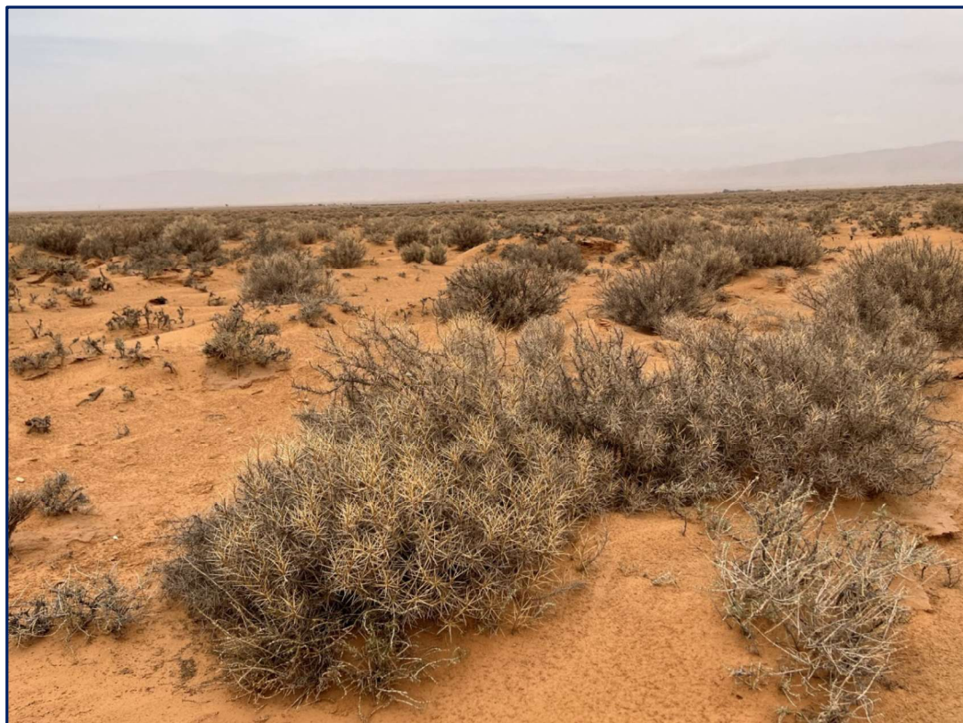
Photo. 4 : Touffes d'Astragale, Astragalus armatus , au niveau de la steppe