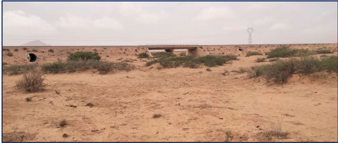
Photo. 7 : Lit d'oued abritant des larges touffes de Zizyphus lotus près du pont