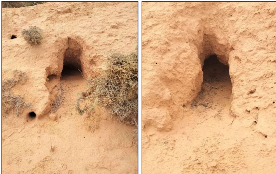
Photos 41 et 42 : Trous creusés par des canidés à la recherche des rats de sable