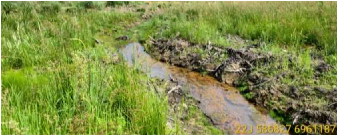
Figura 02. Valas de drenagem presentes no local.