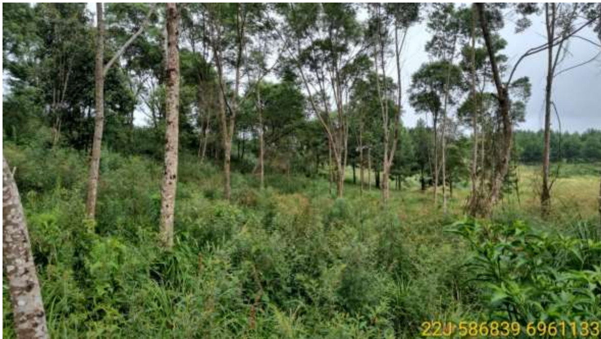
Figura 04. Dominância de Mimosa scabrella (Bracatinga).

Por mais que a família mais frequente tenha sido a Lauraceae, a espécie mais abundante foi Mimosa scabrella (Bracatinga) (Figura 04). O local apresenta ampla alteração, sendo encontrado Pinus taeda (Pinus) (Figura 05) em abundância no local, além de um sub-bosque apenas herbáceo (Figura 06). A segunda espécie mais abundante é a Dicksonia sellowiana (Xaxim), com 21 indivíduos, todos de pequeno porte, somente três, ultrapassando 1,5 m de altura, um grande indicativo de sucesso na relocação (Figura 07).