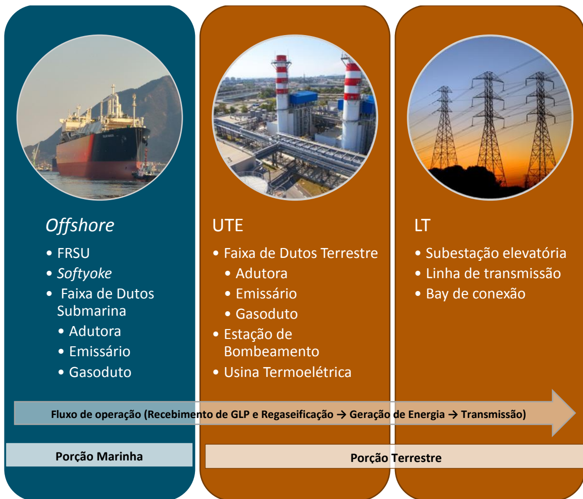
Figura 2: Diagrama das estruturas que compõem as unidades do Complexo Termoelétrico Porto de Sergipe I

A Figura 2 apresenta o diagrama simplificado do empreendimento, com as estruturas distribuídas entre Linha de Transmissão, UTE e Offshore , indicando se a estrutura está localizada em ambiente marinho ou terrestre.