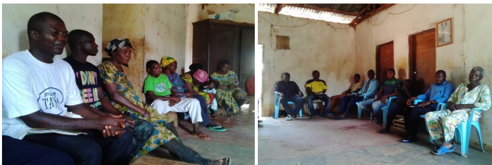
Une vue d'ensemble des participants à la réunion à Minkouma