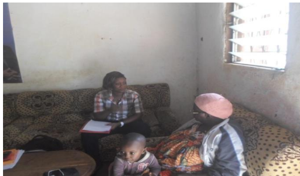
Entretien individuel avec une femme à Emaná-Batchenga