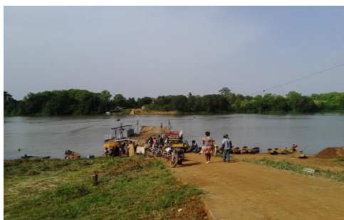
Bac qui relie les départements de la Lékié et du Mbam et Kim