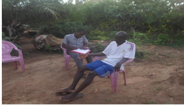
Un entretien individuel avec un homme âgé à Njamé