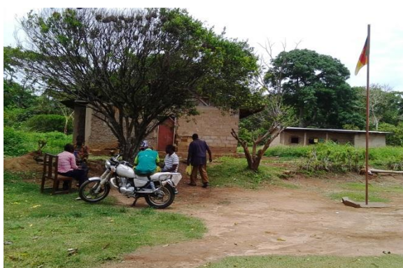
Une discussion ciblée avec les jeunes de Nkonguem 1