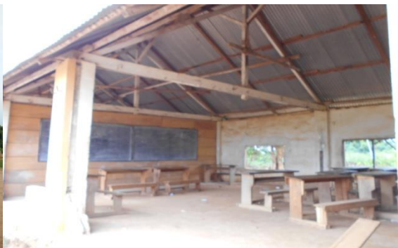
Une vue de l'état des salles de classe du CETIC de Batchenga